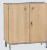
Meuble bas portes battantes 90 - Hêtre - L 90 - H 95 (L/P/H): 900 x 450 x 950