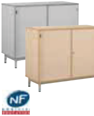
Meuble bas portes coulissantes 120 (L/P/H): 1200 x 450 x 950 mm