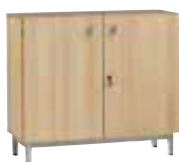
Meuble bas portes battantes 120. (L/P/H): 1200 x 450 x 950 mm