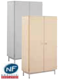
Armoire portes battantes 90 (L/P/H): 900 x 450 x 1800 mm

Structure du meuble en mélaminé ép.: 19 mm. Assemblage de la structure par tourillons collés. Piètement en tube Ø 40 ép.: 1,5 mm; cadre soudé en tube 50/20 ép.: 1,2 mm; revêtu époxy. Vérins de réglage avec une course de 25 mm; non marquant et non tachant. Origine des bois issue de forêts gérées durablement, certifiée PEFC.