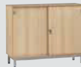
Meuble bas portes coulissantes 120 - Hêtre (L/P/H): 1200 x 450 x 950