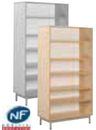
Bibliothèque (L/P/H): 900 x 430 x 1800 mm