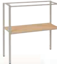
Socle pour meuble 12 et 24 cases- (L/P/H): 897 x 335 x 900 mm