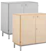
Meuble bas portes battantes 90 (L/P/H): 900 x 450 x 950 mm