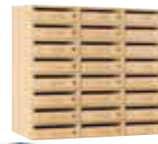
Meuble à courrier 24 cases - (L/P/H): 900 x 400 x 850 mm