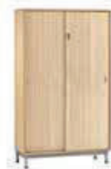
Armoire portes coulissantes 120. (L/P/H): 1200 x 450 x 1800 mm