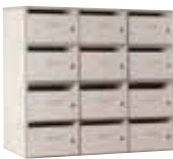
Meuble à courrier 12 cases - (L/P/H): 900 x 400 x 850 mm