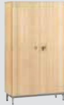
Armoire 2 portes - Hêtre - L 120 - H 180 (L/P/H): 1200 x 450 x 1800