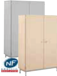
Armoire portes battantes 120 (L/P/H): 1200 x 450 x 1800 mm