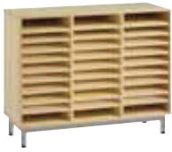
Meuble bas 30 cases (L/P/H): 1045 x 345 x 815 mm

Structure du meuble en mélaminé ép.: 19 mm. Assemblage de la structure par tourillons collés. Piètement en tube Ø 40 ép.: 1,5 mm; cadre soudé en tube 50/20 ép.: 1,2 mm; revêtu époxy. Vérins de réglage avec une course de 25 mm; non marquant et non tachant. Origine des bois issue de forêts gérées durablement, certifiée PEFC.