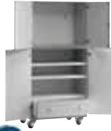
Meuble audio/ vidéo (L/P/H): 900 x 600 x 1850 mm