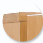
Chants polypropylène (PP) de 2 mm

Classement au feu des bacs plastique - M4.