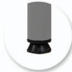
Vérins de réglage