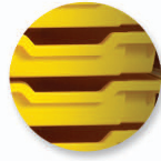
Bac polypropylène Gratnell's®