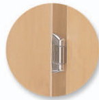
Ouverture à 270°