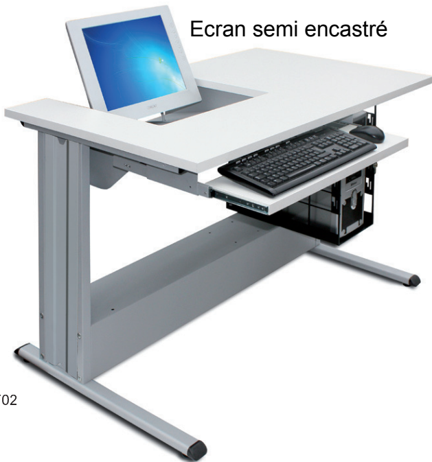
Ecran semi encastré