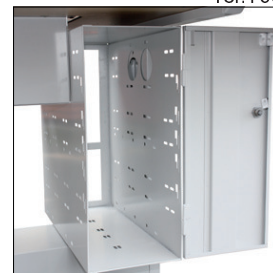
Avec porte métallique renforcée