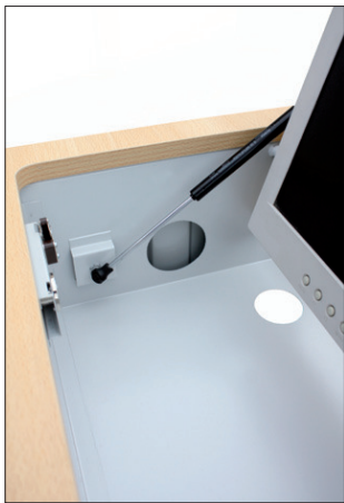
Ouverture par vérin à gaz

SOUDURES GARANTIE A VIE CONTRE TOUS VICES DE FABRICATION