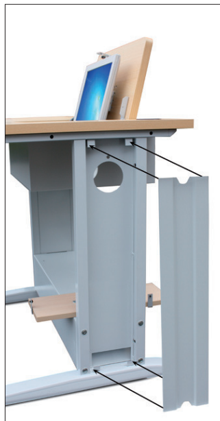
Passage de câbles en vertical et horizontal