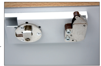
Fermeture et poussoir métallique