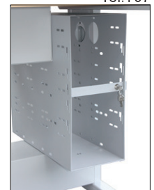
Avec barre sécurisée

Fabrication sur mesures selon vos besoins