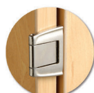
Ouverture à 270°