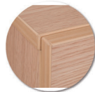
Chants polypropylène (PP) de 2 mm