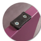
Embouts non tachants et non marquants (polyéthylène).