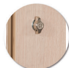
Fermeture morillon + plaque de propreté