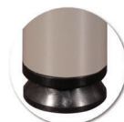
Vérins de réglage