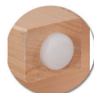
Embouts non tachants et non marquants (polyéthylène).