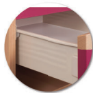
Tiroir sur glissière métalliques