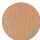
finition verni polyuréthane.

Ne pas utiliser: Solvant cétonique; Pâtes et crèmes abrasives; Détergents (ne pas gratter).