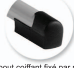
Embout coiffant fixé par rivets. Pas de risque d'infiltration de l'eau lors du nettoyage. Peinture du piètement protégé du frottement des chaussures.