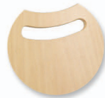
Prise de main; manipulation facilitée