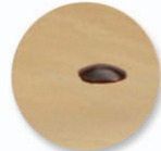
Fixation Vis TRCC et écrou.