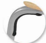
Butée appui sur table + protection angle du plateau de table