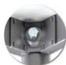
Montage rapide (1 vis).