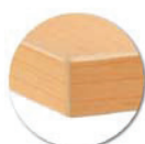
Chants polypropylène (PP) de 2 mm