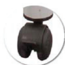
Roulettes double galets