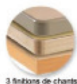
3 finitions de chants