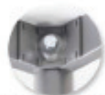
Montage rapide (1 vis)