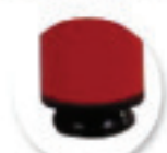
Vérins de réglage