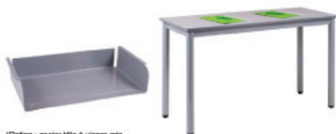
[Option : cazier tôle à visser gris 7037]