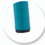
Embout non tachants et non marquants (polyéthylène).