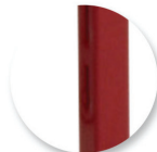
Crémaillère de réglage