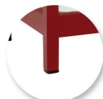
Embouts non tachants et non marquants (polyéthylène).