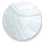
1 coloris disponible.