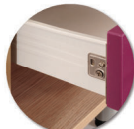
Tiroir sur glissière métalliques