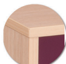
Chants polypropylène (PP) de 2 mm