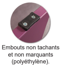
Embouts non tachants et non marquants (polyéthylène).