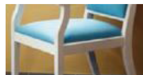
Assise et dossier garnis