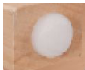
Patin en plastique à pointe ne laissant ni marque, ni tâche